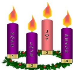
Illustration “Advent candles” (Show Advent Wreath)

Hnub no yog lub caij los txog “3 rd Sunday in Advent - lub limtiam 3 Hnubso.”Hnubno peb yuav saib rau ntawm tus tswmciab xim “pink – pajyeeb” hais txog txojkev “Joy – Kajsiab”. Peb nco ntsoov haistias lub “Advent – caij los txog” yog cov Tuamtsev ua koobtsheej nco txog Yexus Khetos los txog rau lub ntiajteb. Lub caij los txog peb yuav hais txog Yexus los rau lub ntiajteb los ntawm Nws txojkev yug, Nws txojkev los rau hauv peb lub siab uas yog los pub txojkev ntseeg