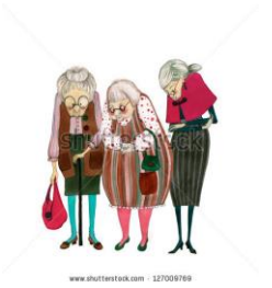
Illustration “Remembering” (Show 3 old ladies)

Muaj ib zaj dabneeg qhia txog peb tus pojniam uas laus laus lawm nyob uake. Ibtug sawv mus pws, thaus nws nce mus txog ibnrab ntaiv xwb nws nres thiab tig los nug haistias, “Puas yog kuv mus sab saud losyog nqis rau sab hauv?” Ibtug teb muaj ntsiv nyaum haistias, “Koj mus sab saud thiab mus pw.” Muaj dua ibtug nqis mus rau ntawm lub tsev ua mov thiab mus ua ib daim ncuav rau nws noj. Thaus nws mus txog ntawm lub tsev ua mov lawm nws tig hu rau nws tus vivncaus uas tseem nyob sab hauv tias, “Kuv los dabtsi rau hauv no? Tus